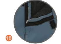
18 CIRTLI VE 20 CM BOYUNDA FERMUARLI ÖN PAT