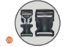
20 PLASTİK GEÇMELİ TOKA