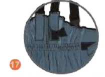
17 DEĞİŞTİRİLEBİLİR ASKI SİSTEMİ