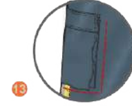
13 YARIM KÖRÜKLÜ YANCEP