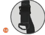
14 AYARLANABİLİR ASKI SİSTEMİ