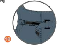
19 BEL AYAR SİSTEMİ