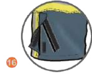
16 PAÇADA FERMUAR